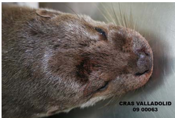
DETALLE DEL CRÁNEO