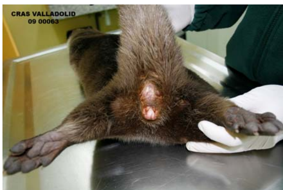
DETALLE DEL SEXADO DEL EJEMPLAR

Lesiones: Fractura múltiple de huesos del cráneo, fractura de pelvis, fractura tóraco-lumbar y fractura de tibia.